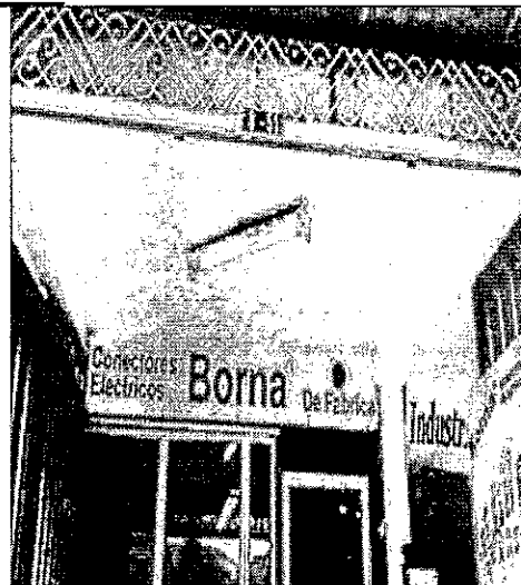
Fotos No. 1. Ubicación del predio donde funcionaba inicialmente la Sociedad Comercial BODEGAS VENECIANAS LIMITADA , ubicada en la Carrera 24 N° 8 – 51.